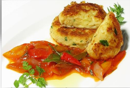
Kaspressknödel auf Peperonata