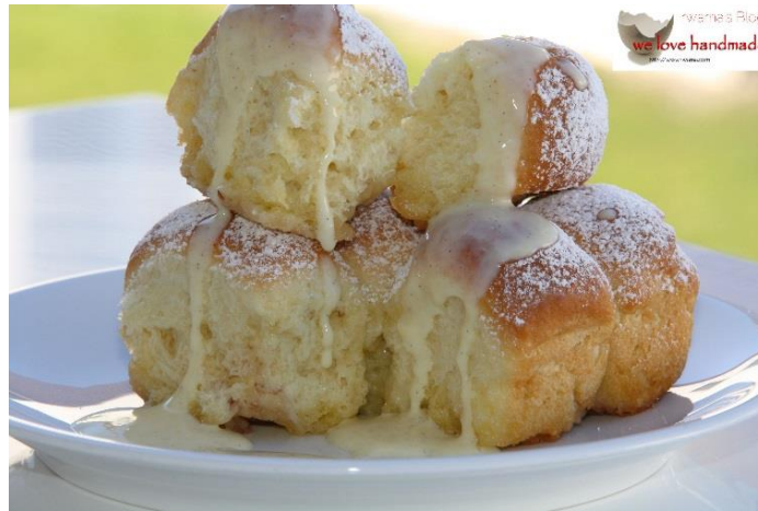
Dampfnudel mit Vanillesoße (Dampfnudln mit Vanillesoß')