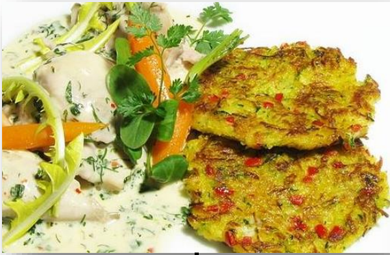
Reiberdatschi "Garibaldi" mit Hendl