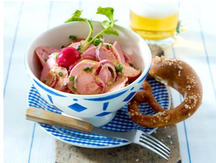
Bayerischer Wurstsalat (Boarische Wurschtsalod)