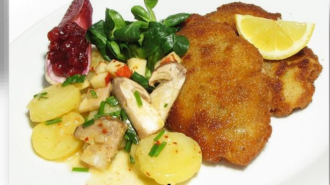
Wiener Schnitzel mit Kartoffel-Steinpilz-Salat