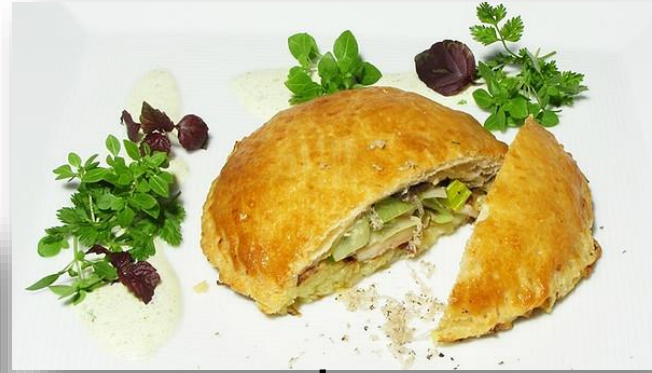
Getrüffelte Kartoffelrösti mit Basilikum-Pinienkern-Sauce