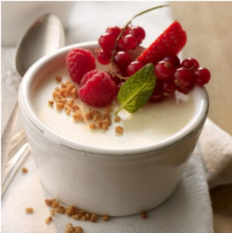
Bayrisch' Creme (Boarisch Creme)